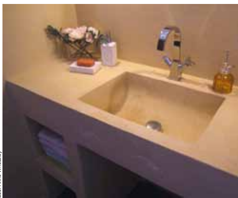
doc. Anne Wheatley

Notons que pour la préparation de ses mélanges, Anne Wheatley prend soin d'ajouter le moins d'adjuvants possible. Et ses mortiers sont réalisés à base de chaux, de sable, de pigments et d'un peu de savon noir, utilisé en agent mouillant, afin de favoriser la dissolution des pigments.